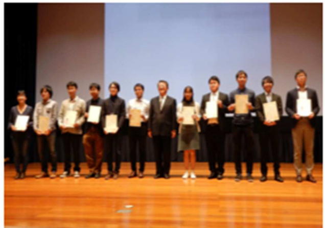
優秀ポスター賞表彰式