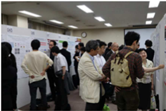
ポスター会場での熱い討論