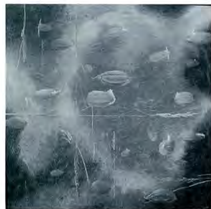
「1日の時刻」(1998, カーボン, アクリル 182×117cm) 「籠りと復活」(2006, 油彩 162×162cm)